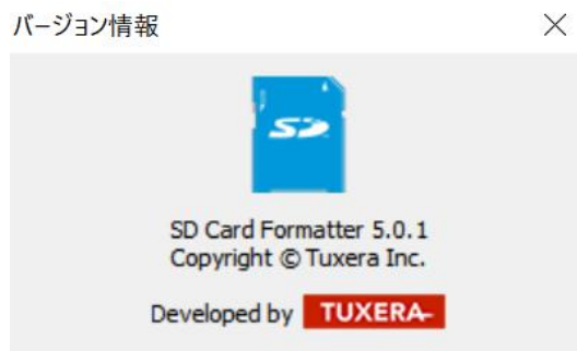
図 2: バージョン情報

Mac OS X/macOS ではメニューの[SD Card Formatter]をクリックし、さらに[SD Card Formatter について]をクリックします。